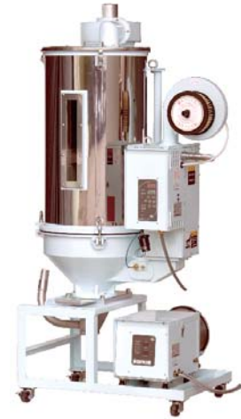
KDD-75X型（ローダーはオプション）