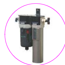
スーパードライヤユニット