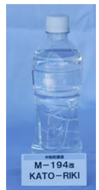
中和防錆液 M-194改 (20ℓ)